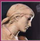
Julie Billiart Soeurs de N.-D.