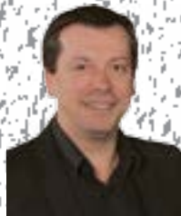
Frédéric Daerden Député-Bourgmestre